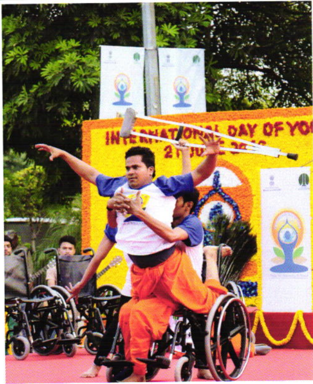
दूसरे अंतर्राष्ट्रीय योग दिवस-2016 के अवसर पर सेंट्रल पार्क, कनॉट प्लेस, नई दिल्ली में सहयोगी संस्थाओं के सहयोग से आयुष मंत्रालय द्वारा आयोजित कॉमन योगा प्रोटोकॉल कार्यक्रम में भाग लेता हुआ युवा दिव्यांगों का एक समूह।